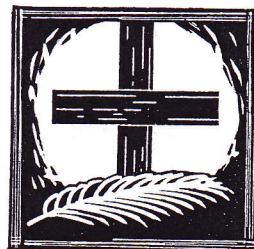
Palmsonntag „Gelobt sei, der da kommt ...“